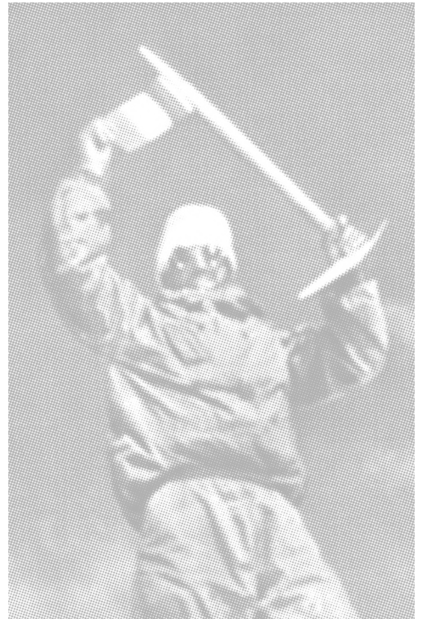
ANAPURNA FIRST ASCENT MAURICE HERZOG 1950

Dans les mains et sous les pieds de nombreux alpinistes, la signature Simond a accompagné les exploits d'hier... et continue d'inspirer ceux de demain.