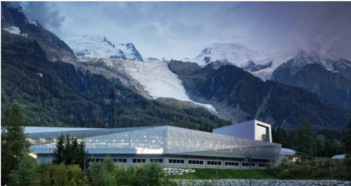
LE BASE CAMP

Le Base Camp (centre de conception et usine) à Chamonix est bien plus qu'un site industriel, c'est un espace pluriel où se croisent recherche, innovation et production, transmission et partage. Ici, les équipes conçoivent et produisent les équipements, testent et contrôlent toutes les gammes de cordes, harnais, sacs à dos, textiles, casques, chaussons et chaussures de montagne, tentes, etc.